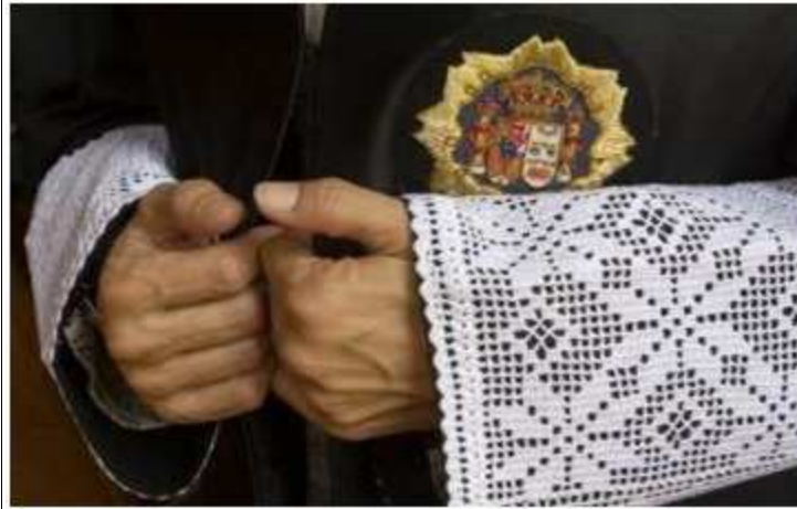
Toga- Imagen añadida por ADCUSPPYMA