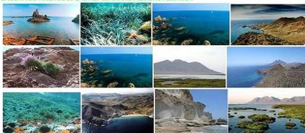
CABO DE GATA-NÍJAR-ALMERIA-ESPAÑA