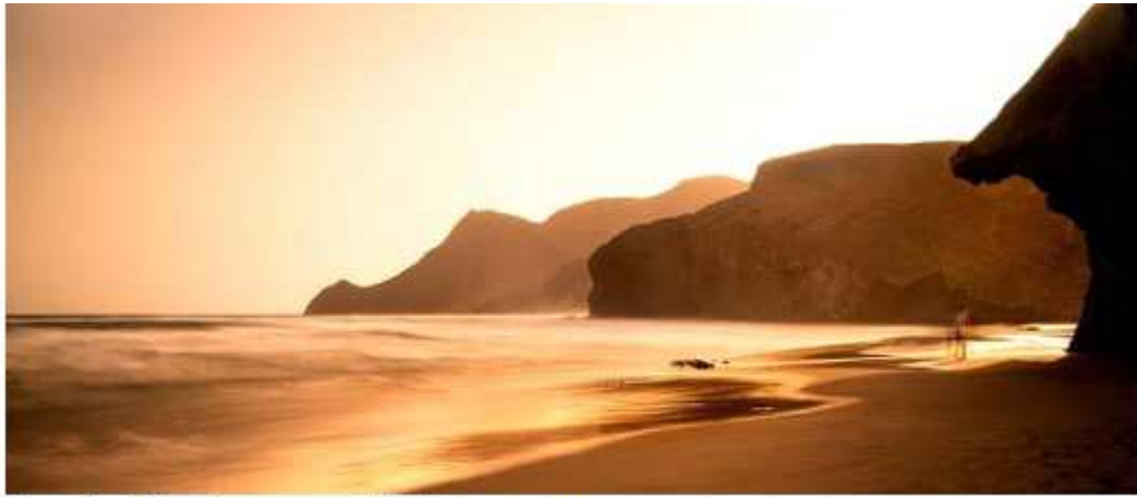
Playa de Mónsul, - Imagen añadida por ADCUSPPYMA