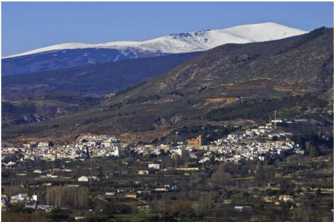
Panoramica de Laujar al fondo Sierra Nevada