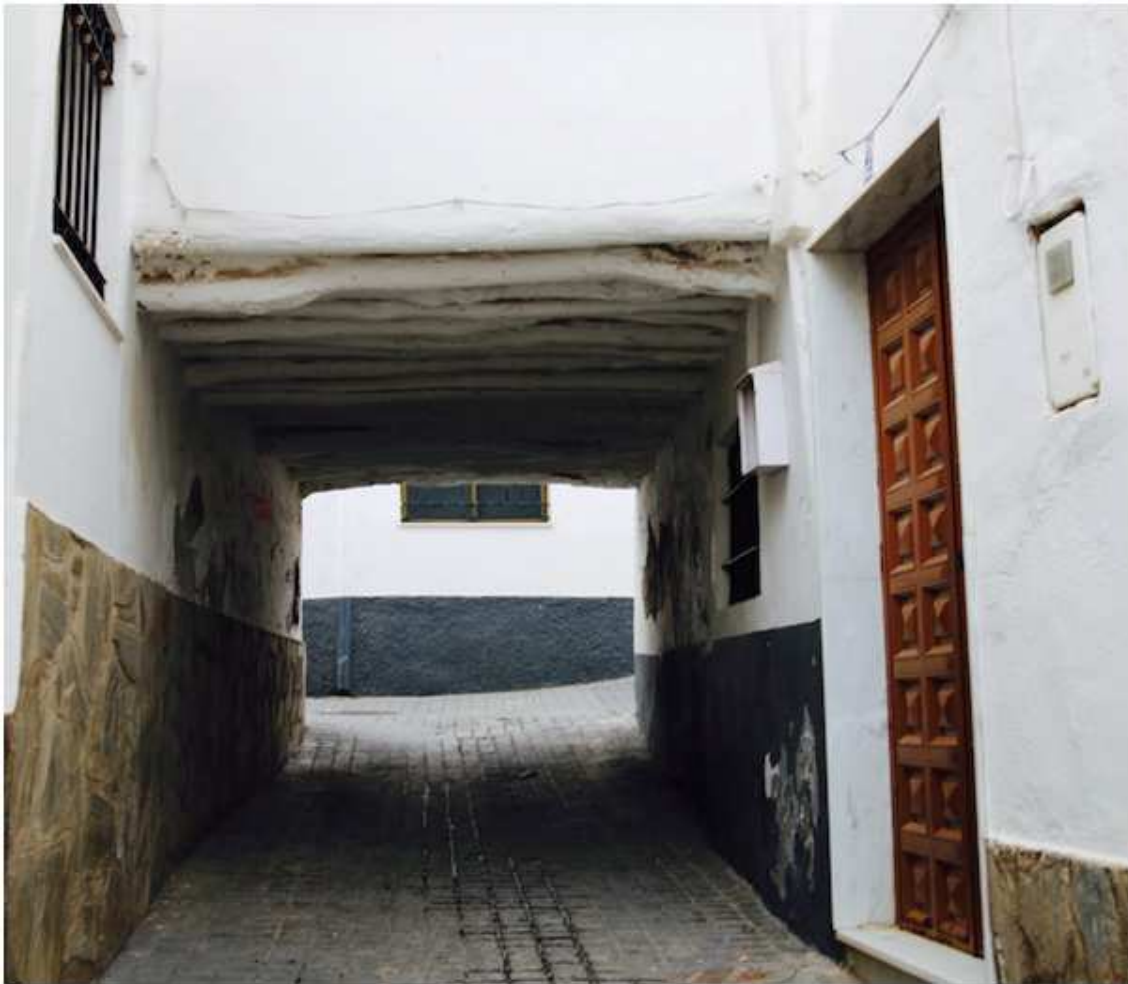
Casa Puente o Covertizo. Eran unos porches que cubrían las calles caracterizados por su arquitectura tradicional alpujarreña.