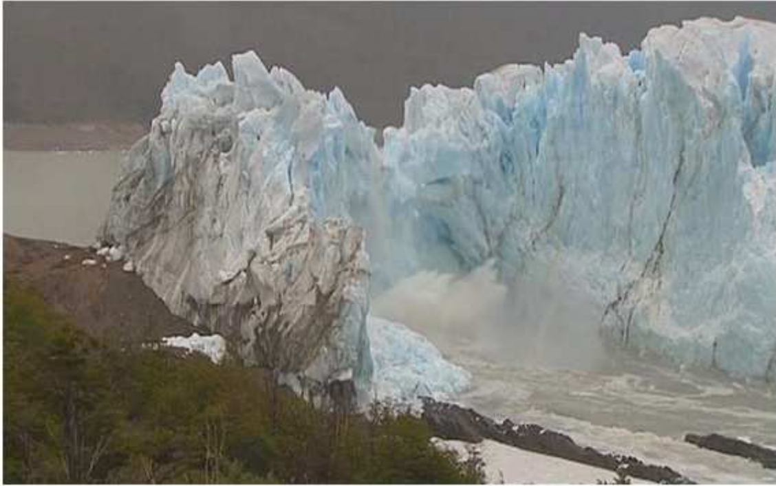
Imagen añadida por ADCUSPPYMA

Otro de los efectos más constatados es la retirada progresiva del hielo continental . Los glaciares retroceden de forma inequívoca y a un ritmo extremadamente rápido. Los Alpes, en Europa, han perdido el 50% de su superficie helada, y alguno de los glaciares más emblemáticos, como los del Monte Kenya en África, ha retrocedido un 92%. Igual suerte han corrido los glaciares pirenaicos en nuestro territorio, con una disminución del 75%. La consecuencia es la pérdida de una importante fuente de agua dulce y de la diversidad biológica asociada. Pero más problemática puede ser la suerte de los glaciares polares. El Ártico ha visto disminuir el espesor de su capa de hielo en un 42%, llegándose en verano a un deshielo casi completo, puesto que allí es donde se está registrando la mayor subida de las temperaturas del planeta. En cuanto al continente antártico, los efectos no son tan evidentes, aunque se estima una pérdida de espesor en algunas zonas del 6%. La importancia de los polos para el conjunto del clima del planeta y la circulación de vientos y corrientes no requiere mayor comentario.