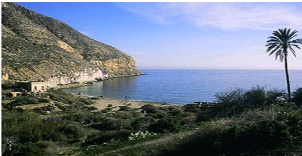
Imagen añadida por ADCUSPPYMA