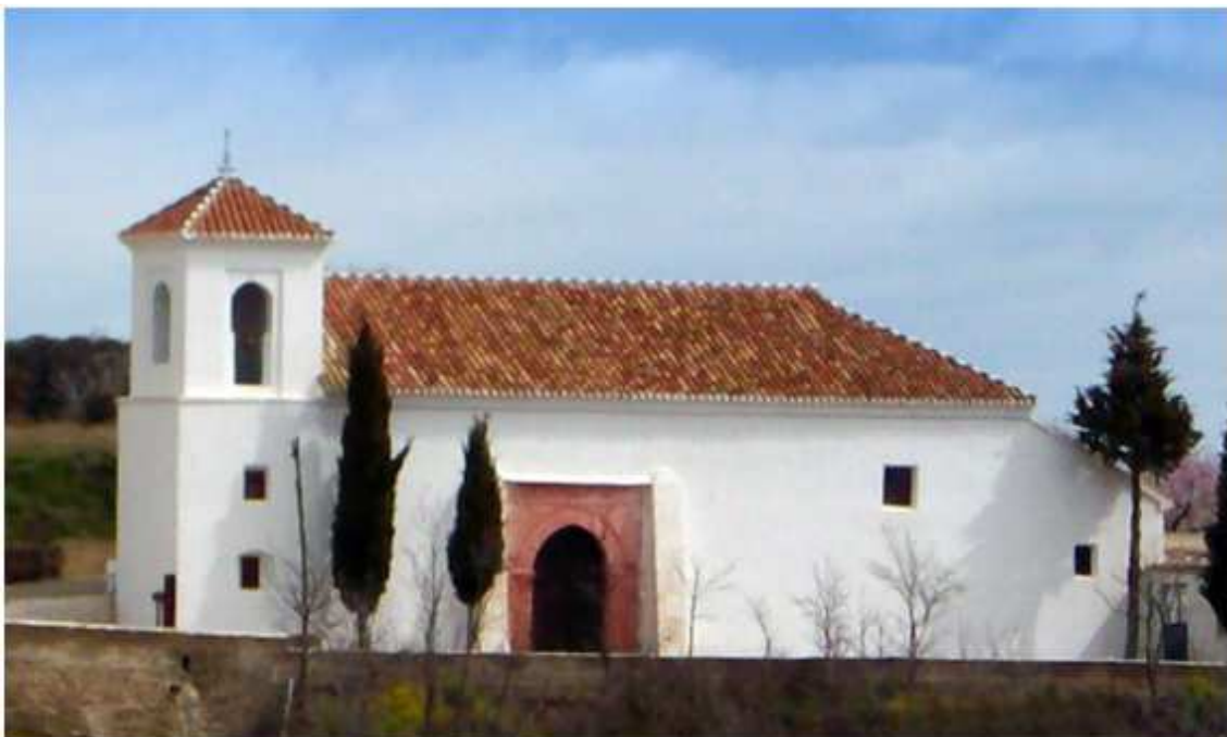
Iglesia de Júbar: Del siglo XII, es una de las más antiguas de La Alpujarra y la única que presenta una armadura ochavada, conserva un pequeño cementerio adosado. Recientemente restaurada, han sido descubiertos en el altar mayor pinturas medievales