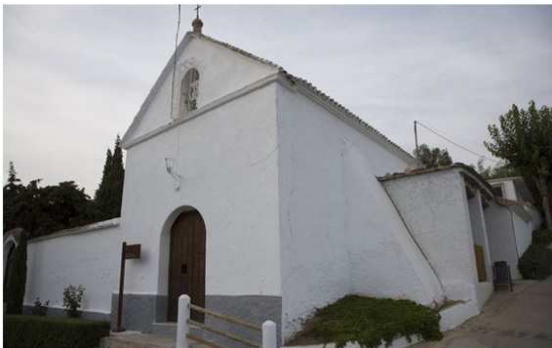
Ermita de San Antón y San Sebastián

en seco posiblemente contemporáneas del Románico -aunque no pertenecen a este estilo-.