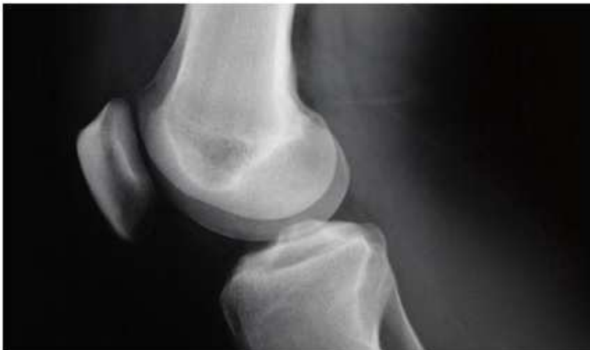
Imagen añadida por ADCUSPPYMA