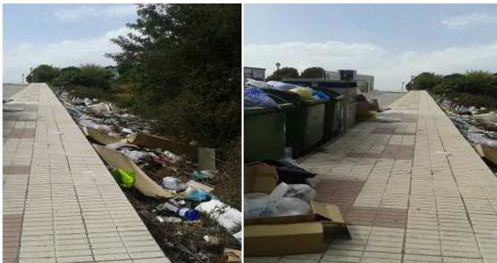
Imagen añadida por ADCUSPPYMA