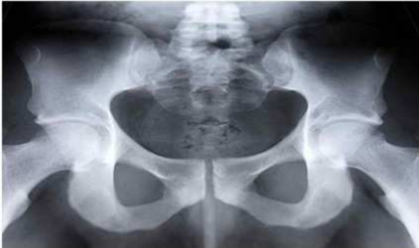
Imagen añadida por ADCUSPPYMA