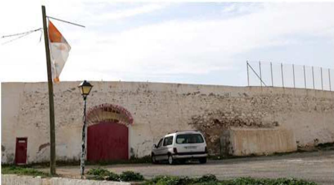
Plaza de Toros. Fue construida en el año 1925.

Sus calles estrechas trazadas en laberinto.