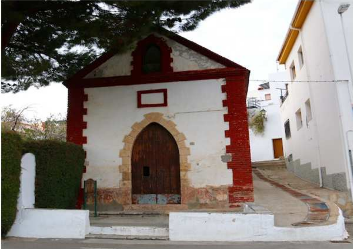
Ermita Chica de las Animas. Se construyó en el siglo XIX . Es de pequeñas dimensiones. Tiene una planta baja y otra superior cubierta de tejas, de estilo barroco. Está dedicada a la Virgen del Carmen.