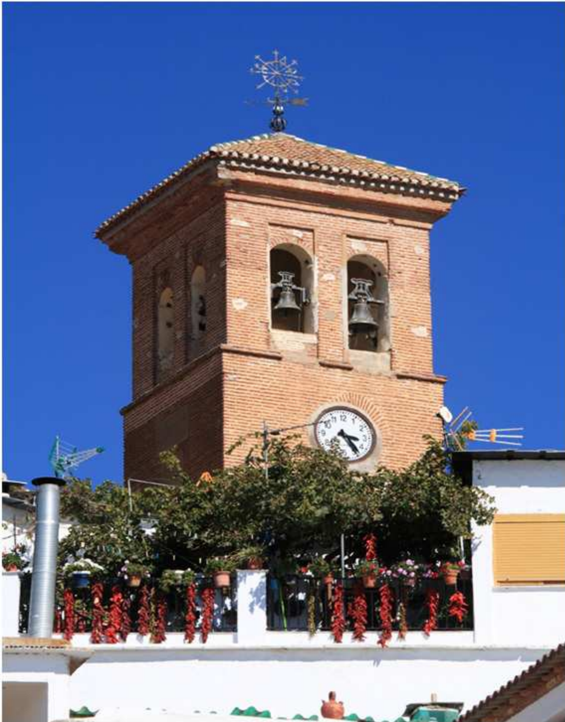
Iglesia de Mairena: Una década después de la rebelión morisca se decía misa “en una Iglesia de las antiguas sanas” que posiblemente se trataría de una antigua mezquita. Esta Iglesia, de comienzos del siglo XVIII, constituye un ejemplo de pervivencia del estilo mudéjar.