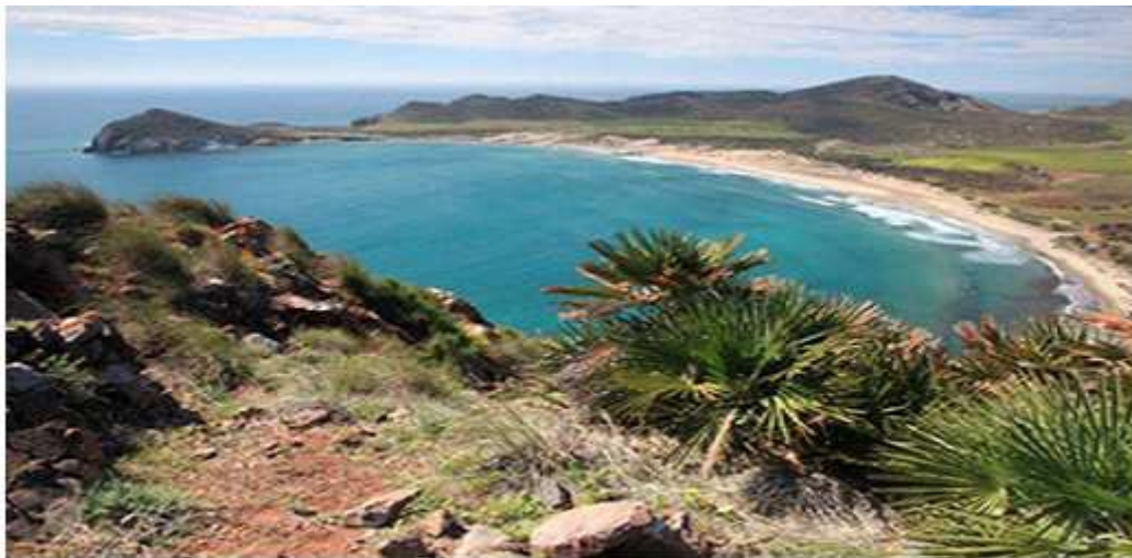
Imagen añadida por ADCUSPPYMA