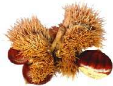
Castañas de la Alpujarra