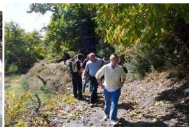
Sendero de los Castaños