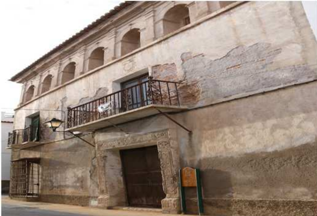
La casa de los Moya, fue construida en el año 1732, correspondía al linaje hidalgo.