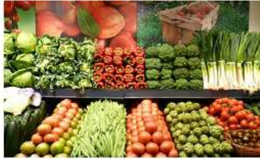
Imagen añadida por ADCUSPPYMA

Los alimentos que más incidieron en el IPC general fueron las legumbres y hortalizas frescas, con un alza del 7,4% (0,071% de repercusión), frente al descenso registrado en 2015, y el pescado fresco (+3,1% y 0,029% de repercusión), subida menor que en 2015 mientras que por el lado de los descensos las frutas frescas cayeron un 2,2% (-0,029%), bajada inferior a la de ese mismo mes del año anterior.