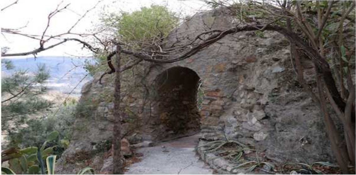
Lavadero del barrio Bajo, del siglo XX.