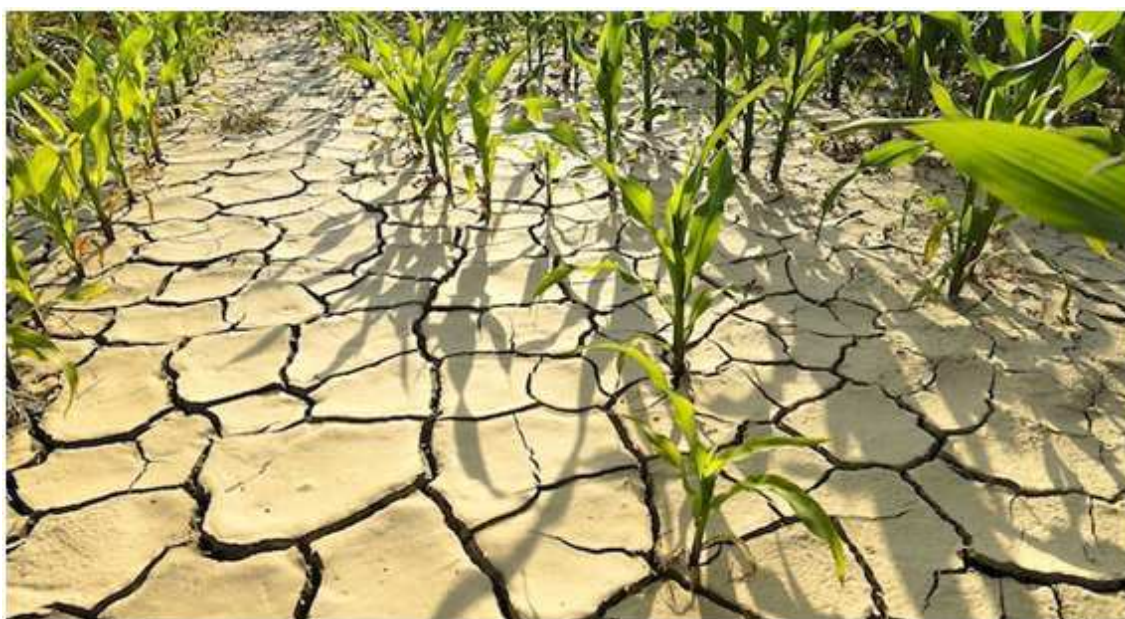
Imagen añadida por ADCUSPPYMA

El cambio climático que de este efecto se deriva es un indicador de la gestión de nuestro modelo de crecimiento. La intensa presión a la que sometemos los recursos y la alta demanda de energía de los países desarrollados –en muchos casos innecesaria e ineficiente- generan abundantes residuos (gaseosos, líquidos o sólidos), algunos de difícil degradación. El despilfarro de las sociedades occidentales, que no consideran los límites de las actividades humanas y que inunda los mercados de bienes cuyo tiempo de renovación es cada vez más corto, está detrás de la mayor parte de los problemas ambientales de nuestro tiempo.