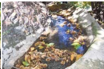
Castañas de las acequias