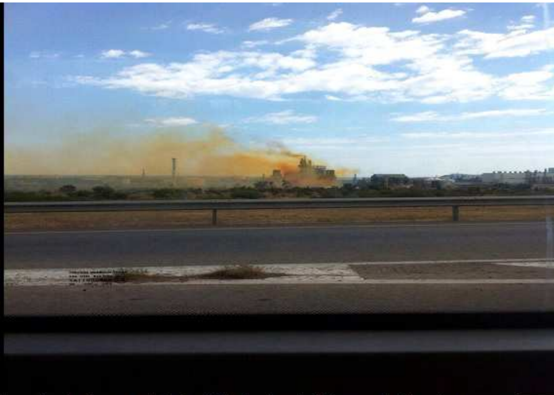
La nube de color anaranjado fue visible desde varios kilómetros de distancia.

La fuga de ácido nitroso, un producto altamente tóxico e irritante, ocurrida el pasado 25 de mayo en la empresa Nitricomax, ubicada en La Canonja, puede tener repercusión penal. Así lo entiende la Fiscalía de Medio Ambiente de Tarragona, que ha abierto diligencias de investigación, según ha confirmado al Diari el fiscal Ignacio Monreal.