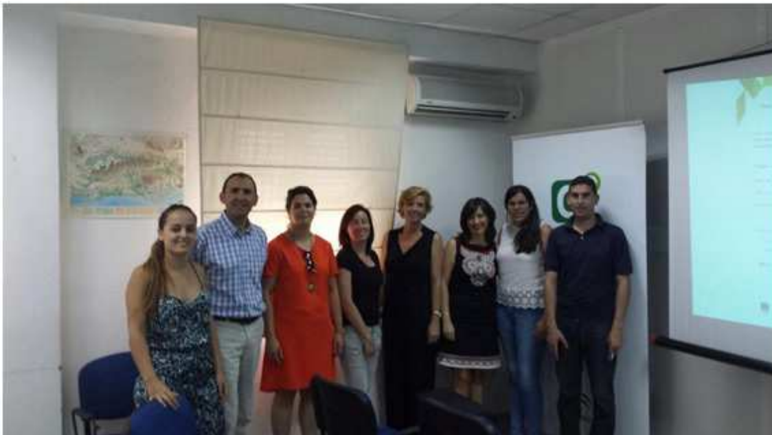
En la clausura del taller Modeló de negocio CANVAS para empresas de reciente creación. En el Cade