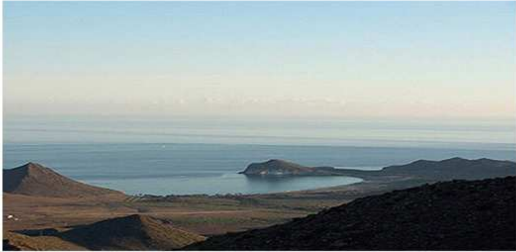
Imagen añadida por ADCUSPPYMA