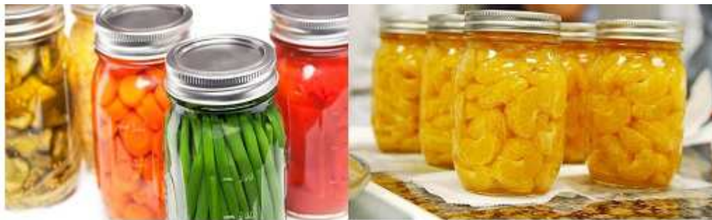
Imagen añadida por ADCUSPPYMA

En diciembre, además, subieron los precios de consumo de carne de ovino (+2,1%), un porcentaje igual que la subida en todo 2016, junto a las patatas y sus preparados (+0,4%) y tabaco (+0,7%).