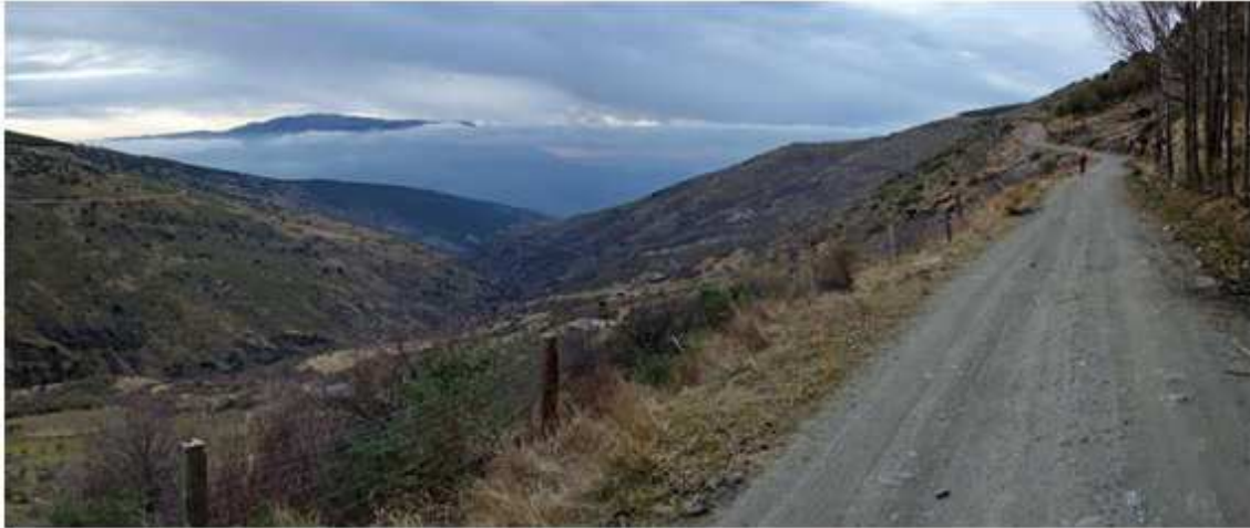
Barranco del Río Laroles: Discurre en dirección norte-sur desde las cumbres de Sierra Nevada. Encajonado entre tajos, contiene un bosque de galería con álamos, sauces y castaños de apreciable antigüedad.