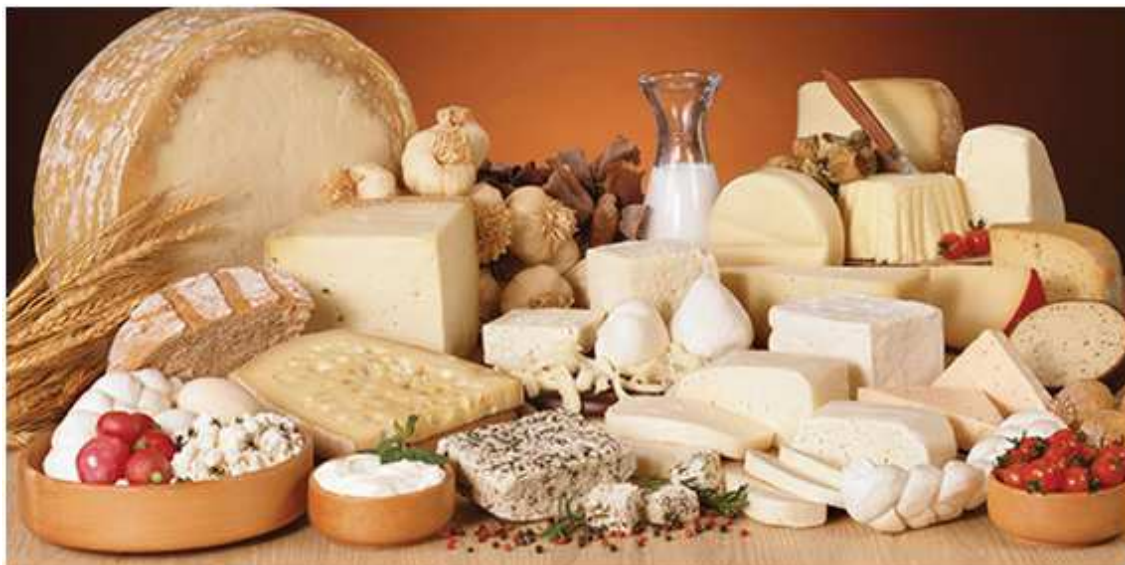
Imagen añadida por ADCUSPPYMA

Durante el año en su conjunto, el índice se situó en un promedio de casi 164 puntos, esto es, un 11,4 % más que en 2015, pero muy por debajo de los valores registrados en los cinco años precedentes.