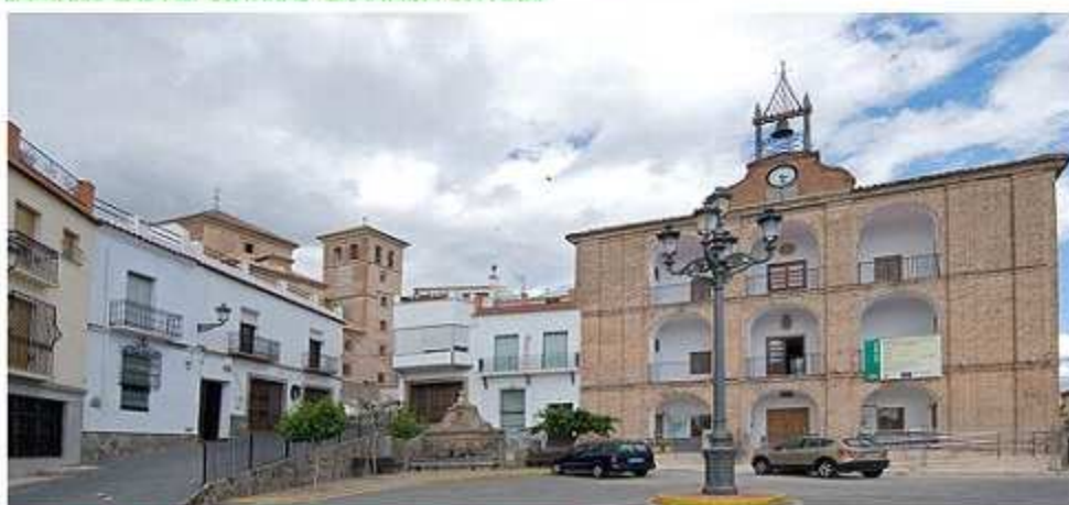
LAUJAR DE ANDARAX-LAS ALPUJARRAS-ALMERIA-ESPAÑA