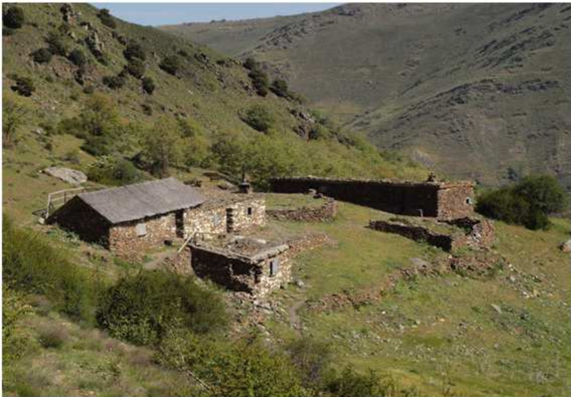
Horcajo del Hornillo: Cabecera del valle de alta montaña de la Cuenca del Río Adra en el que confluyen diversos barrancos. En este lugar se localiza abundante flora endémica de Sierra Nevada.