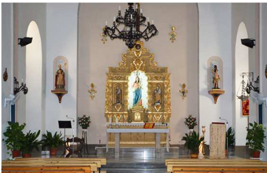
Ermita de las Ánimas de Picena

En cuanto a ermitas en el municipio de Nevada, cabe señalar la “Ermita de San Sebastián” de Laroles, la “Ermita de las Ánimas” de Picena y la “Ermita de la Virgen