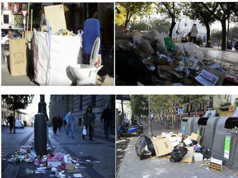
Imagen añadida por ADCUSPPYMA