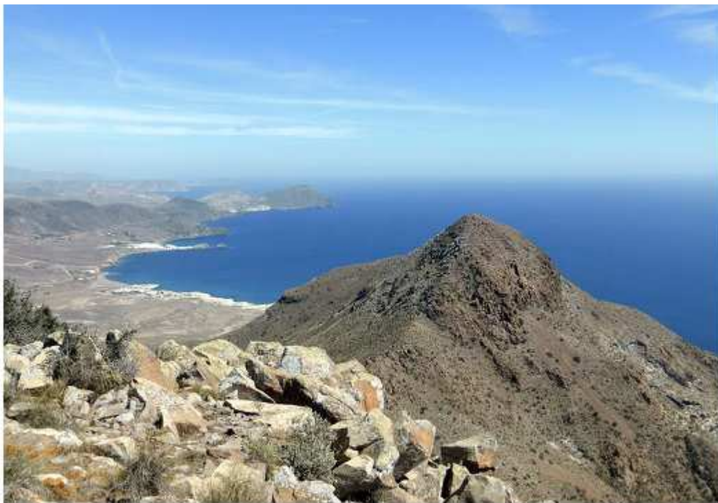
El Cache- Imagen añadida por ADCUSPPYMA