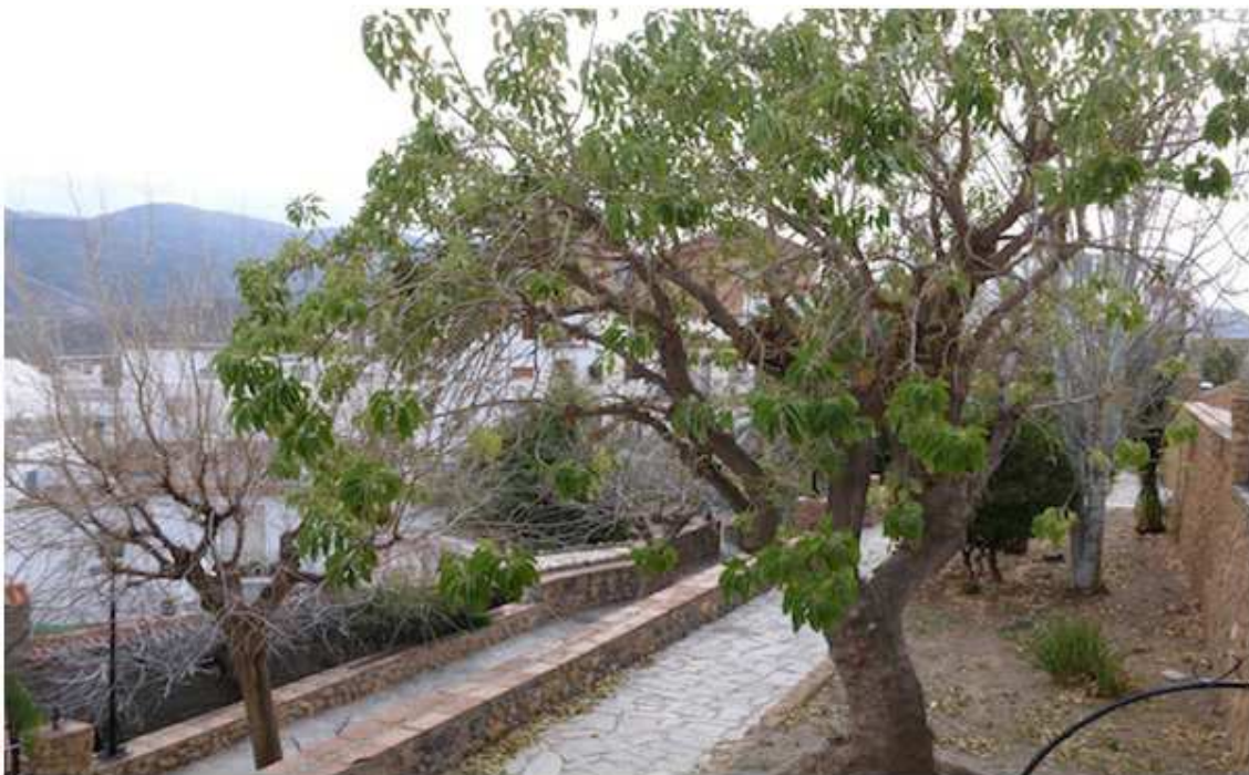
Jardín de la Almazara. Es un parque ideal para practicar deporte, dispone de un gran número de máquinas para realizar ejercicios.