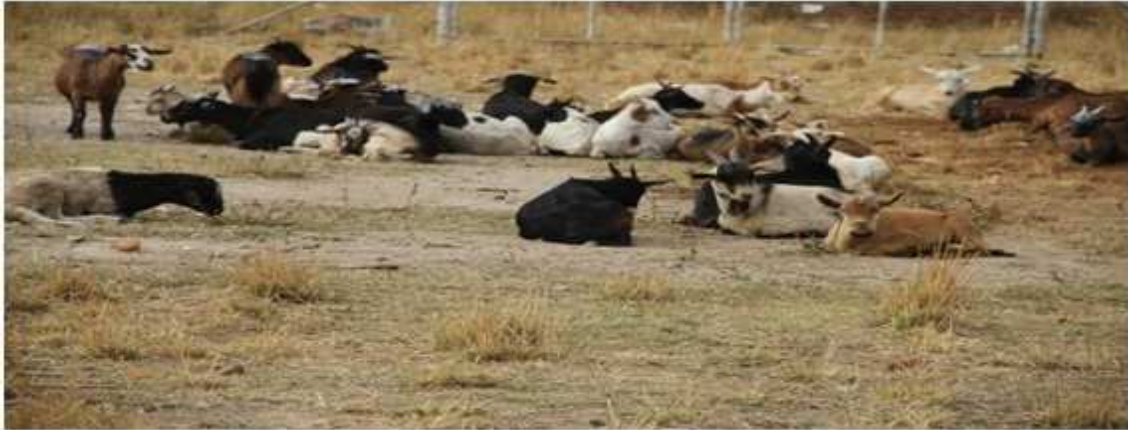
Imagen añadida por ADCUSPPYMA

Hasta ahora hemos comentado algunas de las consecuencias sobre los seres humanos. Mas, ¿qué le ocurrirá al resto de las especies? La respuesta es que la gran mayoría tendrá que realizar un considerable esfuerzo para adaptarse a las nuevas condiciones, lo que en función de su vulnerabilidad se realizará con diferentes posibilidades de éxito. Una de las especies más amenazadas es el oso polar, especie única que verá peligrar su supervivencia en la medida en que se destruye su hábitat. Las especies migratorias verán alterados sus ritmos con el riesgo de que su alimento no esté disponible en el momento de su llegada. Los vectores infecciosos, cuyo aumento –como se ha visto- corre paralelo al de la temperatura, pueden dañar también a muchas especies, lo que ya está sucediendo con los delfines mediterráneos. Los ciclos reproductivos en anfibios y reptiles pueden verse alterados. Y la diversidad, en general, reducida. Uno de los entornos más ricos, como son los arrecifes de coral, pueden degradarse al perder las algas microscópicas. Según algunas previsiones, para finales de siglo, el 50% de las especies pueden encontrarse dentro de las listas de riesgo que anualmente elabora la Unión Internacional para la Conservación de la Naturaleza.