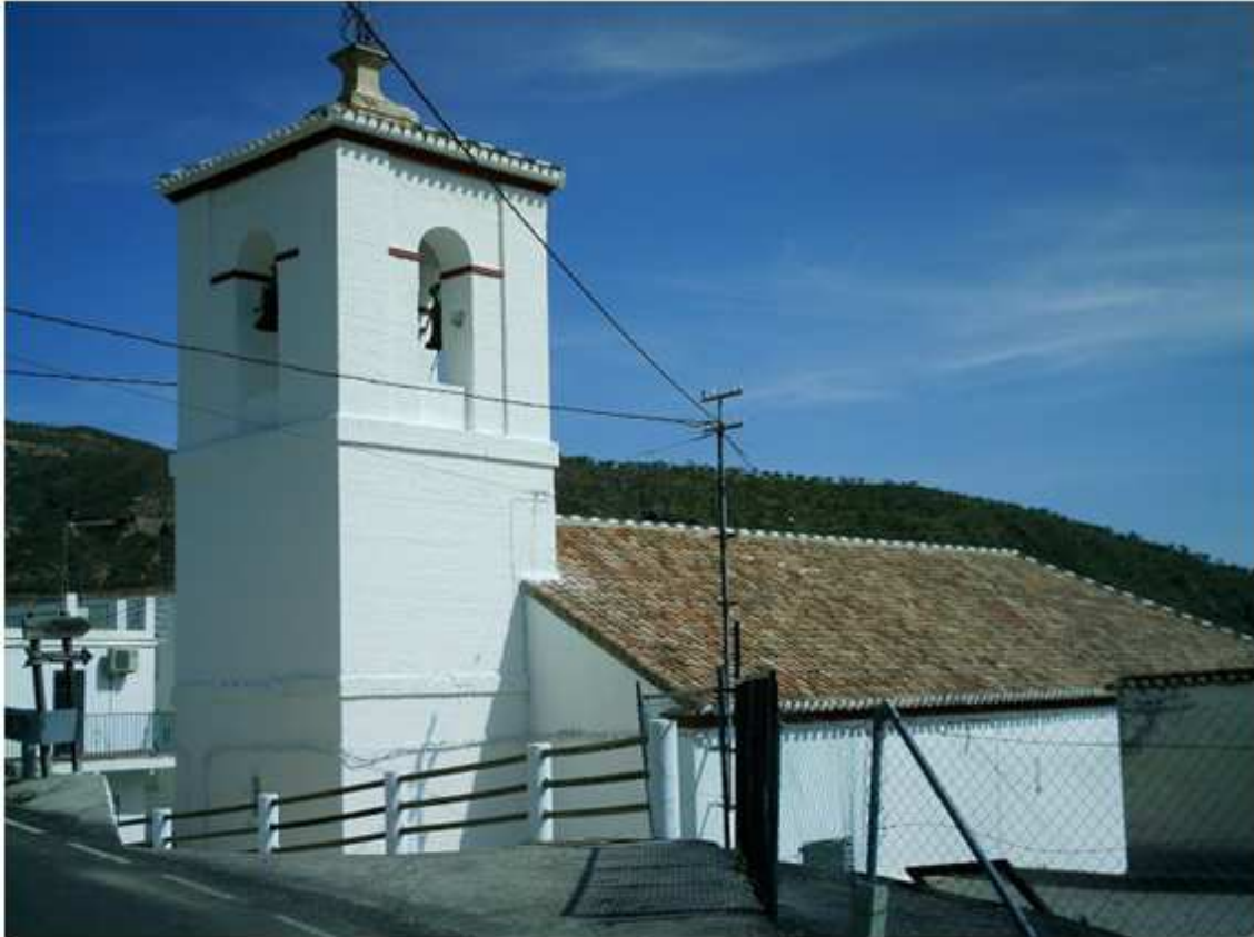
Iglesia de Píkena: La primitiva iglesia data del siglo XVI y reconstruida en el siglo XVIII. Supone un modesto ejemplo de arquitectura neoclásica.