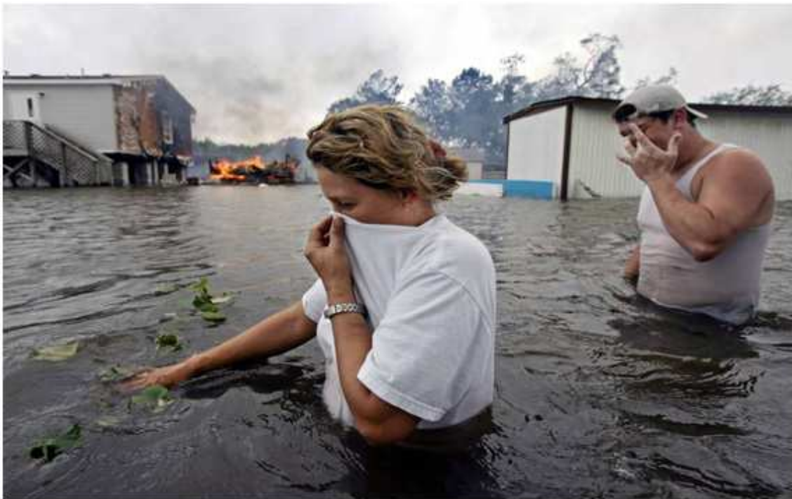
Imagen añadida por ADCUSPPYMA

Otro motivo de preocupación viene por las enfermedades infecciosas, que serán más frecuentes con temperaturas más elevadas. La malaria, por ejemplo, está apareciendo en zonas nuevas y en altitudes donde nunca antes se había registrado; tal es el caso de las poblaciones de Kenya, los Andes colombianos o Jaya Irian en Indonesia. Mayor temperatura puede, igualmente suponer la extensión del radio de influencia de la fiebre amarilla, el dengue o la fiebre del Nilo, entre otras, así como afectar a la propagación de garrapatas y mosquitos.