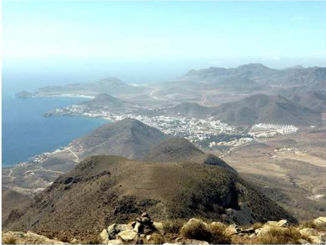
Domos volcánicas de los Frailes- Imagen añadida por ADCUSPPYMA